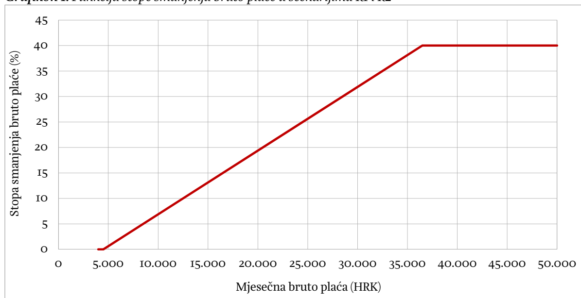
Grafikon 1. Funkcija stope smanjenja bruto plaće u scenarijima R1 i R2

U oba je hipotetska scenarija pretpostavljeno smanjenje bruto plaće zaposlenika po progresivnoj stopi koja je izračunata kao funkcija bruto plaće. Ta stopa za plaće do 4.500 kn iznosi 0%, nakon čega postupno raste do maksimalnog iznosa od 40% za bruto plaće iznad 36.500 kn (grafikon 1.). Rastuća stopa opravdava se načelom da osobe s nižim dohotkom troše veći dio dohotka za zadovoljenje „nužnih potreba“. Zbog toga zaposleni s najnižim bruto plaćama u ovim scenarijima snose nulti ili vrlo nizak teret. Kako bi se, međutim, mogla ostvariti određena proračunska ušteda, potrebno je jače opteretiti osobe s višim plaćama, za koje se pretpostavlja da će i, unatoč znatno većim smanjenjima bruto plaće, moći podmiriti svoje osnovne potrebe u vremenu krize. Parametri funkcije stope smanjenja (nagib krivulje i maksimalna stopa) određeni su proizvoljno, a hipotetski scenariji služe kao ilustracija. Moguće je zamisliti i brojne drukčije funkcije smanjenja bruto plaće. 3