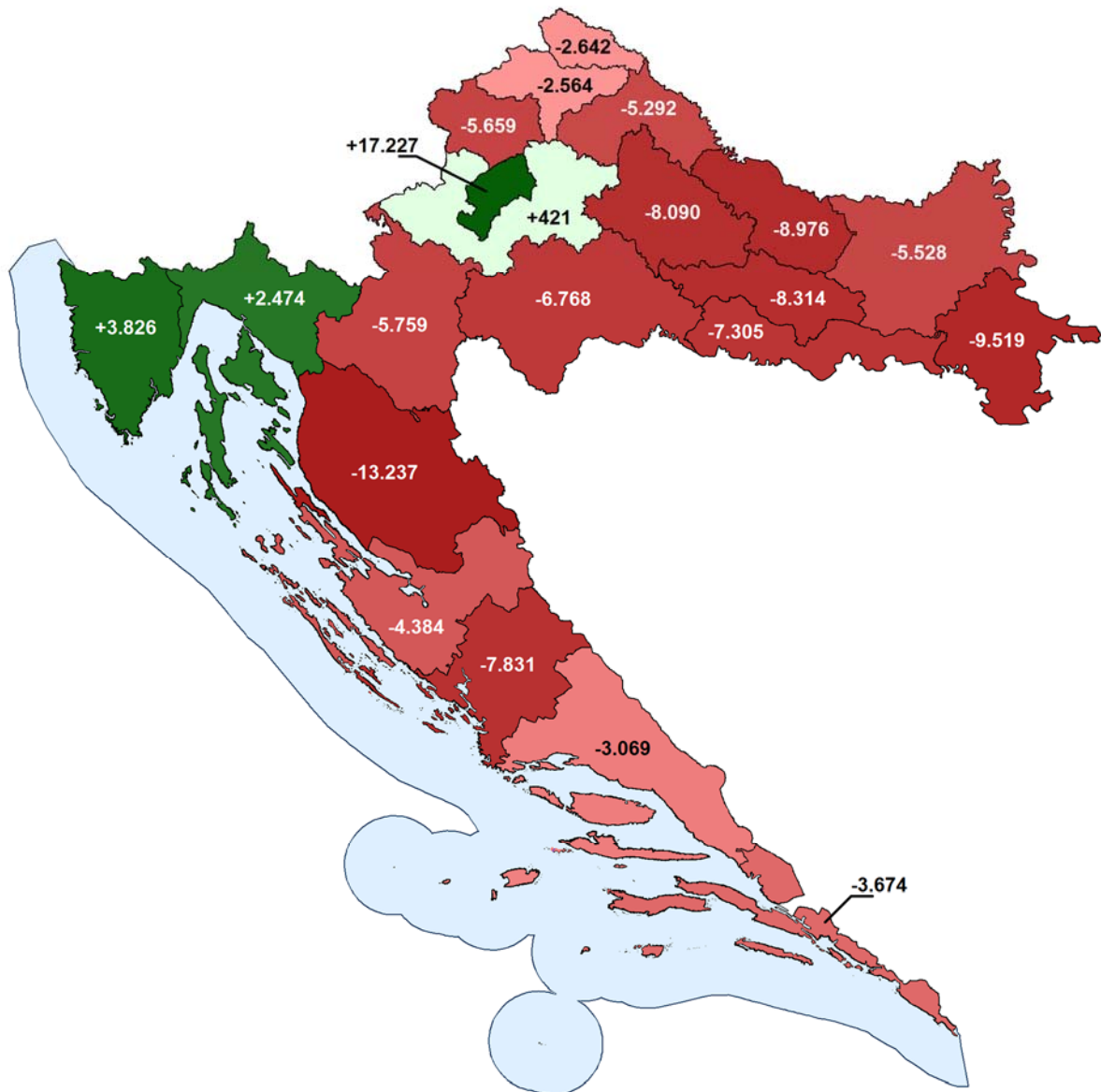
Mapa neto fiskalnih pozicija po stanovniku, prosjek razdoblja 2011.-13. (u kn)